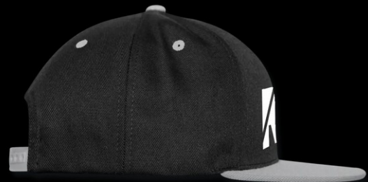
Kontrast Snapback Cap mit geradem Schirm